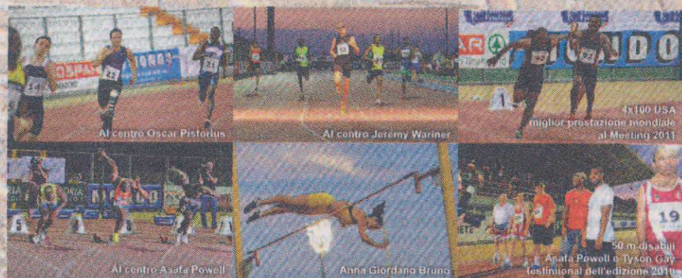
Al centro Oscar Pistorius

LOTTERIA BENEFICA ABBINATA ALLA GARA DEI 400m, CON LA PARTECIPAZIONE DI OSCAR PISTORIUS